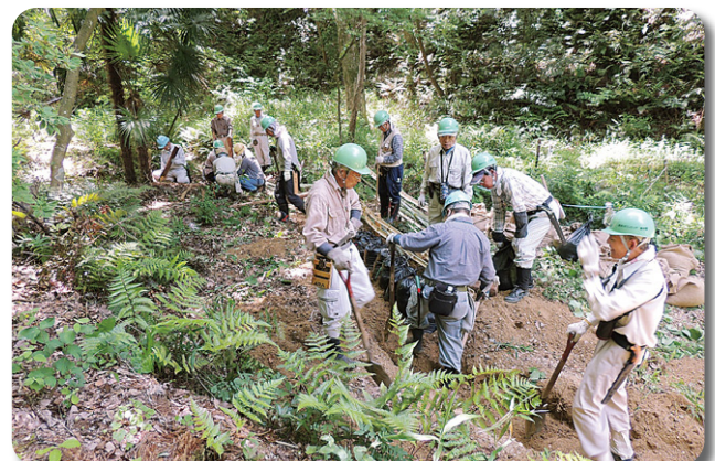
大杉谷のシダ群落の保護活動

三木山活動地は兵庫県立三木山森林公園（約80ha）の一画（東地区、約10ha）で、標高は海拔100m前後の比較的低い土地にありますが、台地、斜面、谷底、低湿地など地形が変化に富んでいることから、様々な動植物が観察でき、整備が進むに連れて希少種の復活も見られています。森林整備活動は1997年から開始して、2014年現在で18年目に入っています。毎月の活動参加者は20名前後で、除伐、下草刈り、作業道整備が主な作業となりますが、四季折々の花木を愛で、原木シイタケ作りにも取り組んでいます。また、ヘルメット、ノコギリ、剪定ばさみなどの必要な道具類を準備してありますので、見学や体験希望も随時受け付けています。