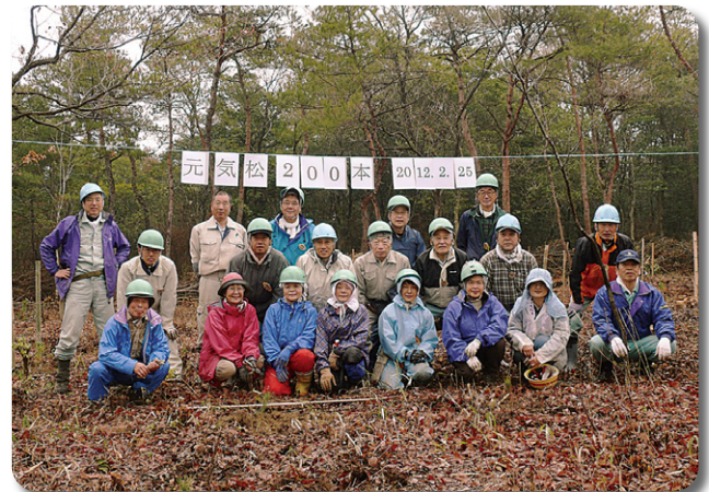
ひょうご元気松を200本植樹