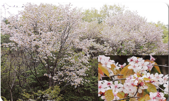
あけぼの谷のカスミザクラ