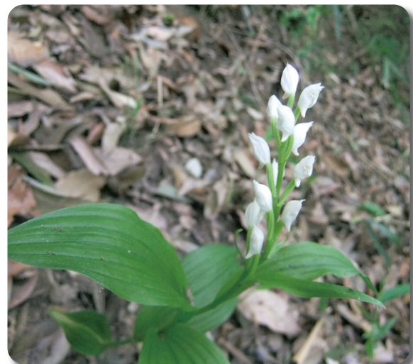
太子の森の代表的野草その1:ギンラン