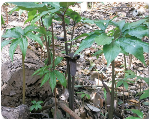
太子の森の代表的野草その2:ウラシマソウ