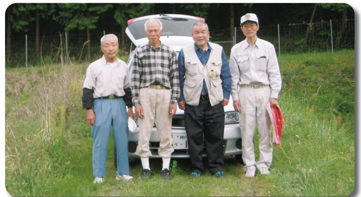
梶原活動地:メンバー