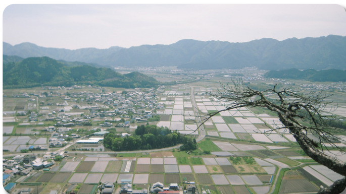
小富士頂上東側(春日方面)の眺望