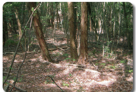
麓~小富士への散策道